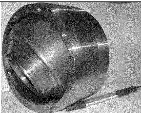
Рисунок 2 - Корпусная опора с покрытием

Для определения триботехнических характеристик покрытий был создан специализированный стенд, осуществляющий вращение сфер и их перемещение в вертикальной плоскости. Удельная нагрузка при испытаниях изменялась от 2 до 6 МПа, что соответствует эксплуатационным условиям работы корпусных опор. Результаты испытаний представлены в таблице 2.