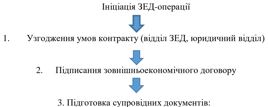
Схема 1. Основні етапи документообігу у сфері ЗЕД на ВАТ НВП «Радій»