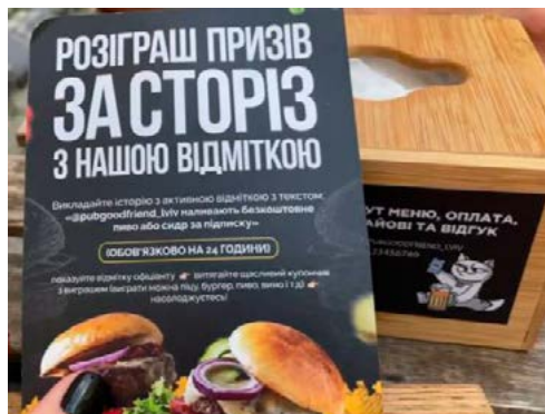
Рис. 1. Рекламний постер за столиком пабу «Добрий Друг» із QR-кодом доступу до інтерактивного меню та умовами розіграшу призів за сторіз в Інстаграм, літо 2022 р.

підкріплена якісним поєднання авторської кухні та крафтового пива. Лінійка із 26 сортів крафтового пива та низки авторських наливок і коктейлів доповнена ситними порціями смачних наїдків (від бургерів і піци до гастросету «Тарілка гурманів»).