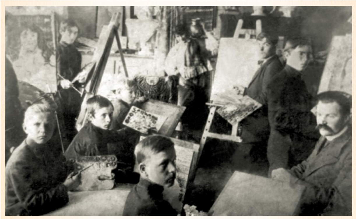
Рис.12 Рисувальний клас ЄЗРУ

Також вагомою складовою навчально-виховного процесу стала бібліотека ЄЗРУ, яка поділялася на фундаментальну та учнівську. 1870 р., «на час відкриття бібліотека мала 448 назв та 768 томів видань. Значну частину книг для бібліотеки училища пожертвував доцент Новоросійського університету (нині Одеський національний університет ім. Мечникова) О. Ф. Стюарт. Учнівська бібліотека та початку діяльності училища не була відкрита із-за незначної кількості книг» 74 . Учнівська бібліотека була відкрита 1874 р. 75 Правління училища «за клопотанням педагогічного колективу виписувало вітчизняну та зарубіжну новітню наукову та навчальну літературу, періодику. Загалом протягом 1871-1872 навчального року, на ці потреби було виділено 1300 руб. ... Загалом, правління та дирекція ЄЗРУ приділяли значну увагу розвитку бібліотеки, виписували потрібну літературу із-за кордону. Наприкінці 1913 р., бібліотечні фонди ЄЗРУ нараховували 11388 одиниць зберігання, зокрема, 4002 видання (9334 томи) на суму