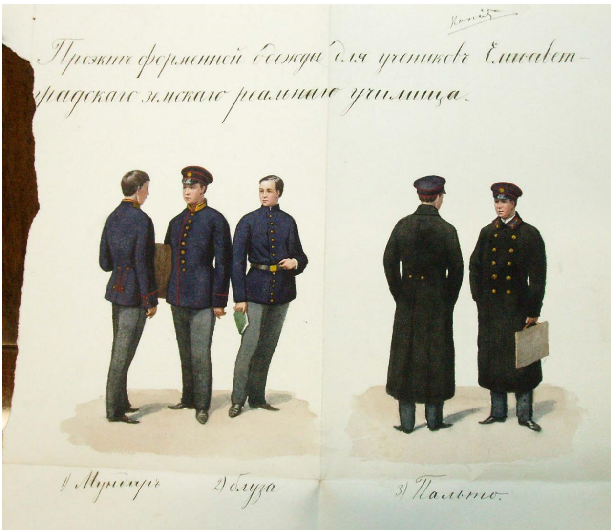
Рис.17 Ескізи форменого одягу учнів Єлисаветградського Земського реального училища

Серед справ фонду 60 Єлисаветградське земське реальне училище значна частина стосується господарчої діяльності цього навчального закладу. Це, зокрема, справа 7 «Справа про купівлю будинку для училища», справа 16 «Справа про страхування рухомого і нерухомого майна в училищі», справа 19 «Список учнів з відмітками плати за навчання», справа 20 «Справа позичково-ощадної каси службовців», справа 21 «Прибутково-видаткова книга Єлисаветградського земського реального училища», справа 25 «Розрахункова книга позичково-ощадної каси службовців училища», справа 26 «Розрахункова книга позичково-ощадної каси службовців училища», справа 27 «Прибутково-видаткова книга Єлисаветградського