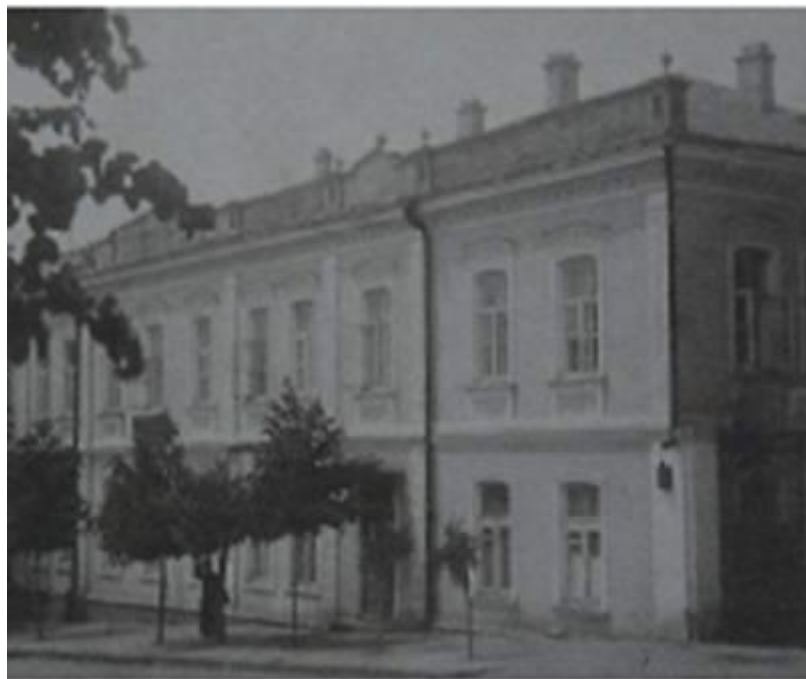
Рис.8 Будівля Єлисаветградської жіночої гімназії Єфимовської

державних та громадських гімназій. Отримували атестати за 7-й клас, свідоцтва домашніх наставниць та учительок по закінченню 8-го класу та свідоцтва за будь-який клас при виході з гімназії до її закінчення чи переведенні до іншої гімназії. Право видачі атестатів та свідоцтв належало педагогічній раді без усіляких ускладнень та обмежень, що існували для приватних закладів» 45 .