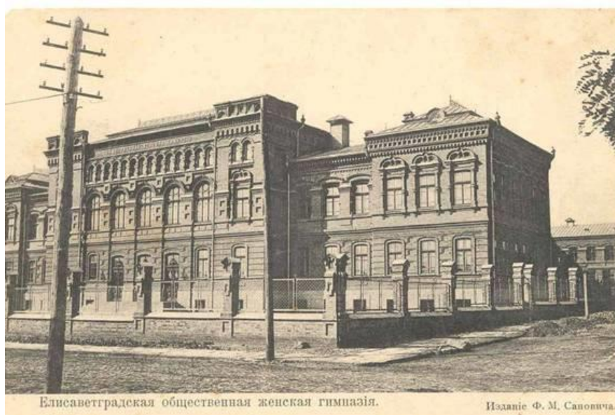
Рис.5 Єлисаветградська громадська жіноча гімназія