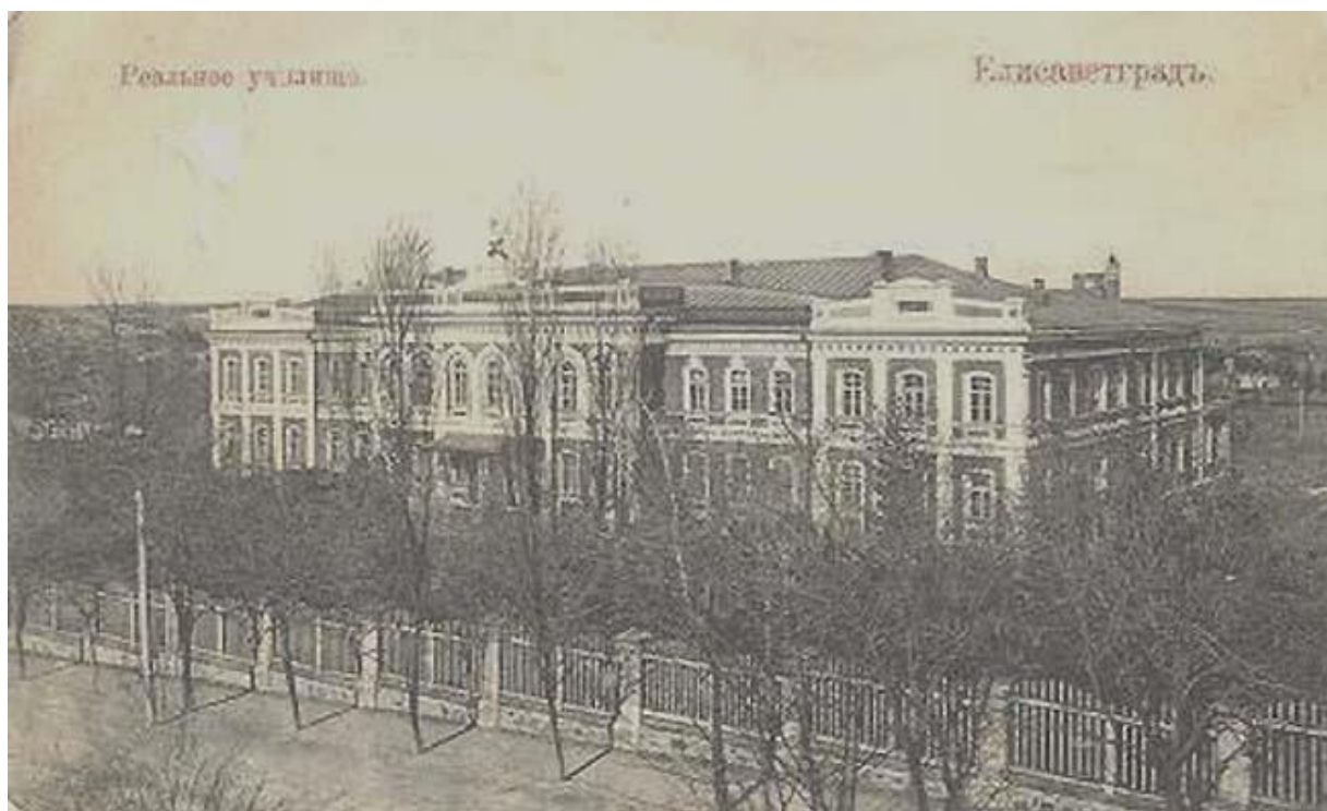
Рис.9 Єлисаветградське земське реальне училище