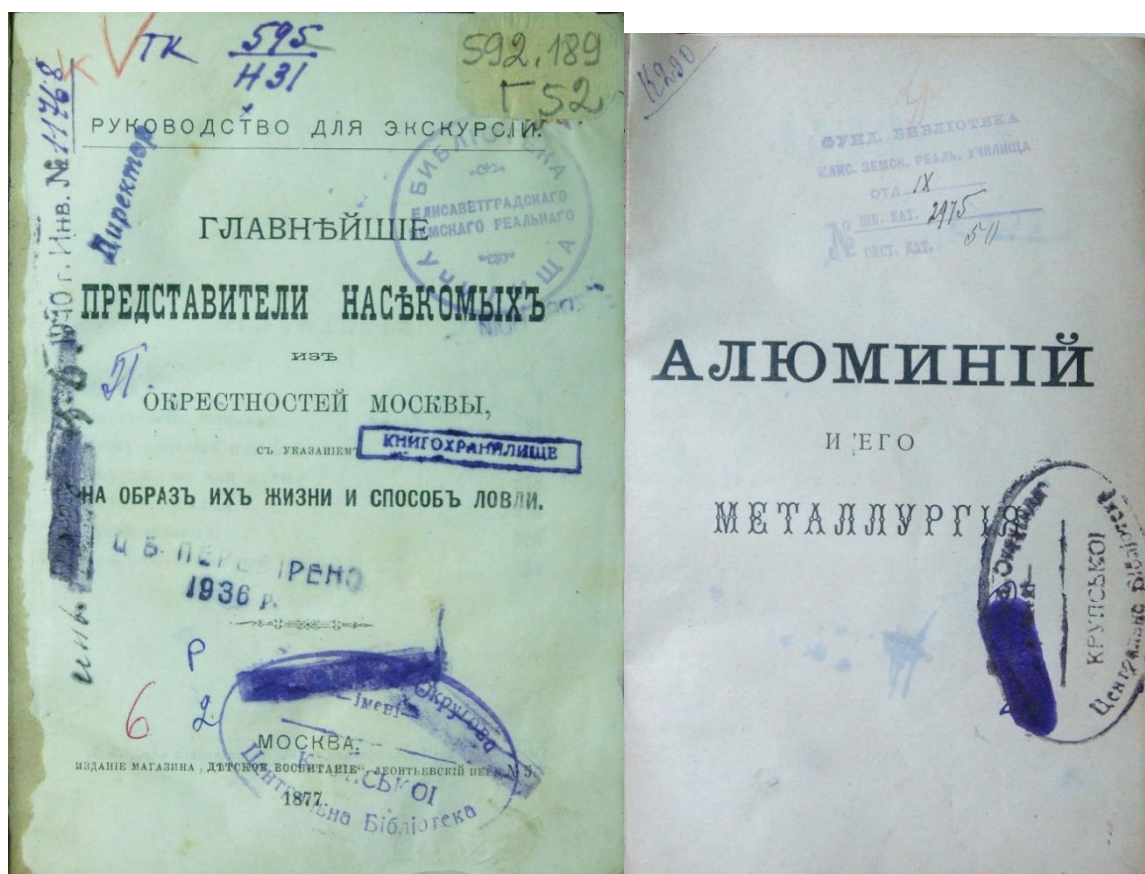
Рис.13 Книги із штампами фундаментальної та учнівської бібліотеки Єлисаветградського земського реального училища

До речі, частина бібліотечного фонду Єлисаветградського земського реального училища зберігається у фондах Державного архіву Кіровоградської області та Обласній універсальній науковій бібліотеці ім. Д.І. Чижевського 77 . У фонді відділу рідкісних і цінних видань Обласної універсальної наукової бібліотеки ім. Д.І. Чижевського, на сьогодні, у значна частина книг зі штампами фундаментальної та учнівської бібліотеки Єлисаветградського земського реального училища (Рис.13-14).