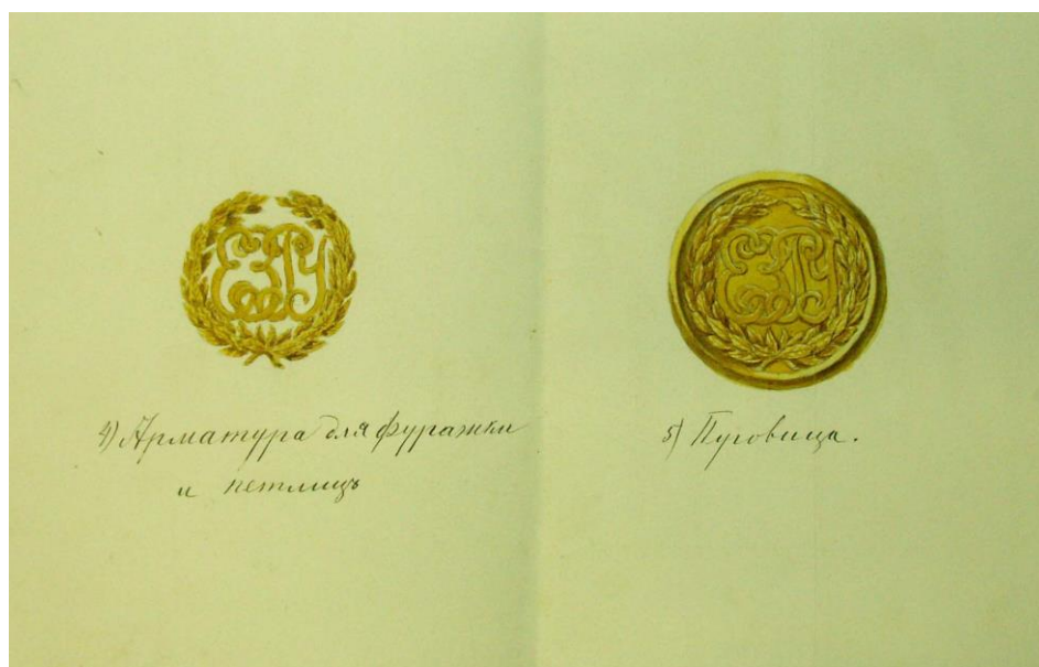
Рис.16 ескіз арматури для кокарди та петлиць, а також гудзика для форми учнів Єлисаветградського Земського реального училища

На його околичці над козирком, розміщувався жерстяний позолочений знак у формі двох перехрещених гілок з лавровими листами, між якими розміщувалися ініціали училища. Установлювався й літній варіант форменого одягу, зокрема парусинові блузи з чорним ремінним поясом і парусинові штани та білий полотняний кашкет із встановленими буквами. Окрім цього, учням Єлисаветградського Земського реального училища дозволялося носити башлик із верблюжого сукна (без галуна) та шинель із темно-зеленого сукна, за зразком військових, але без клапанів (петлиць) 84 . Дана справа, як уже зазначалося містить і зображальні документи, зокрема є ескіз арматури кокарди та петлиць (Рис.16) та ескізи форменого одягу учнів Єлисаветградського Земського реального училища (Рис.17).