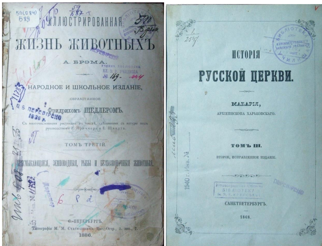
Рис.14 Книги із штампами фундаментальної та учнівської бібліотеки Єлисаветградського земського реального училища

У першому розділі розглядаючи історіографію ЄЗРУ ми згадували серед плеяди визначних особистостей чия діяльність була пов'язана із реальним училищем, постать видатного педагога кінця XIX – початку XX ст. М. Завадовського, становлення та професійне зростання якого було тісно пов'язано з ЄЗРУ. Михайло Ромулович Завадський обіймав посаду директора училища у 1876-1882 рр, був редактором і видавцем «першого в Російській імперії незалежного від Міністерства народної освіти журналу “Педагогический вестник”, що виходив двічі на місяць у м. Єлисаветграді протягом 1881-1882 рр. Загалом, аналізуючи навчально-виховний процес у ЄЗРУ, необхідно зазначити, що училище було творчою лабораторією передових педагогічних ідей тогочасності» 78 .