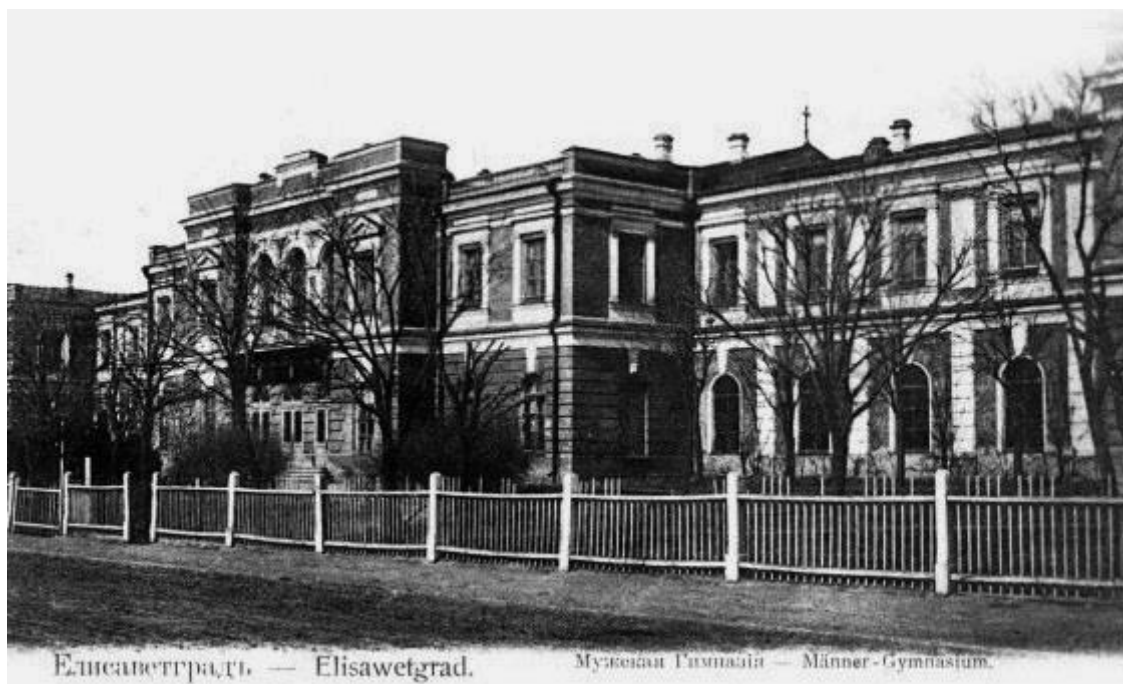
Рис.3 Єлисаветградська чоловіча гімназія

спеціально для московських купців, розташувався колись унікальний навчальний заклад» 36 .