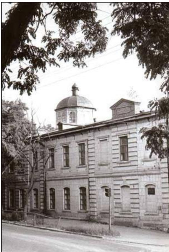
Рис.2 Єлисаветградське духовне училище

і в духовній освіті – церковно-приходська школа, духовне училище (4-9 клас), духовна семінарія. Випускники гімназій могли продовжити освіту у духовній академії, а випускники семінарій – в університетах. Часто випускники духовних училищ вступали до 5-6 класу класичної гімназії» 35 .