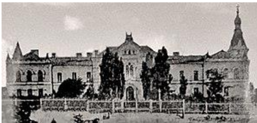
Рис.4 Златопільська чоловіча гімназія

Здатопільського повітового дворянського училища та Златопільської чоловічої прогімназії яка 1885 р. була перетворена на «повну класичну чоловічу гімназію» 38 .