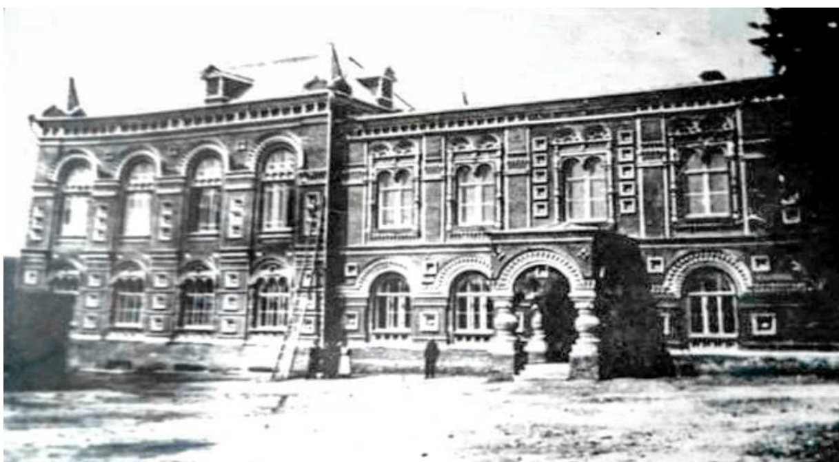
Рис.6 Ремісничо-грамотне училище