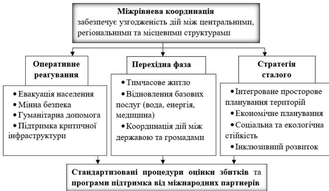
Рисунок 2 – Модель інтеграції воєнного та післявоєнного реагування на рівні ОМС

На рисунку 2 запропонована модель інтеграції воєнного та післявоєнного реагування на рівні органів місцевого самоврядування, яка відображає системну послідовність управлінських дій , спрямованих на забезпечення безперервності функціонування територіальних громад у кризових умовах та на етапі відновлення.