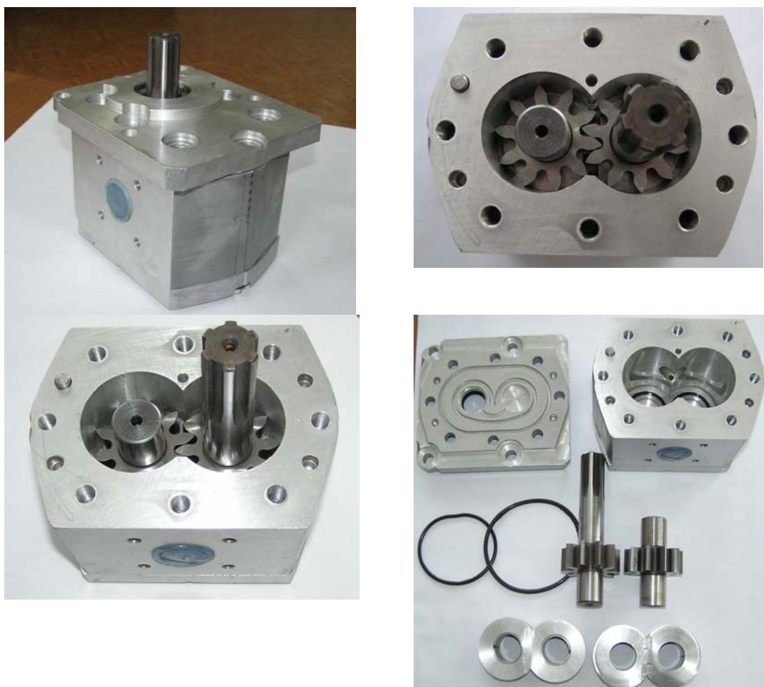
Рисунок 1 - Общий вид, устройство и детализовка экспериментального насоса с повышенной удельной подачей НШ-32-3 УУРОН

Столь существенное увеличение функциональных параметров экспериментального насоса НШ-32-3 УУРОН стало возможным благодаря использованию предложенной методике расчета ЗЗ. Следует также отметить то, что результаты могли бы быть существенно выше, однако жесткие ограничения производителей, которые были наложены на проектируемый насос НШ-32-3 УУРОН, а именно – оставить без изменения межцентровое расстояние A = 45 \text{ мм} , увеличить количество зубьев шестерен (табл. 1) – не позволили этого сделать.