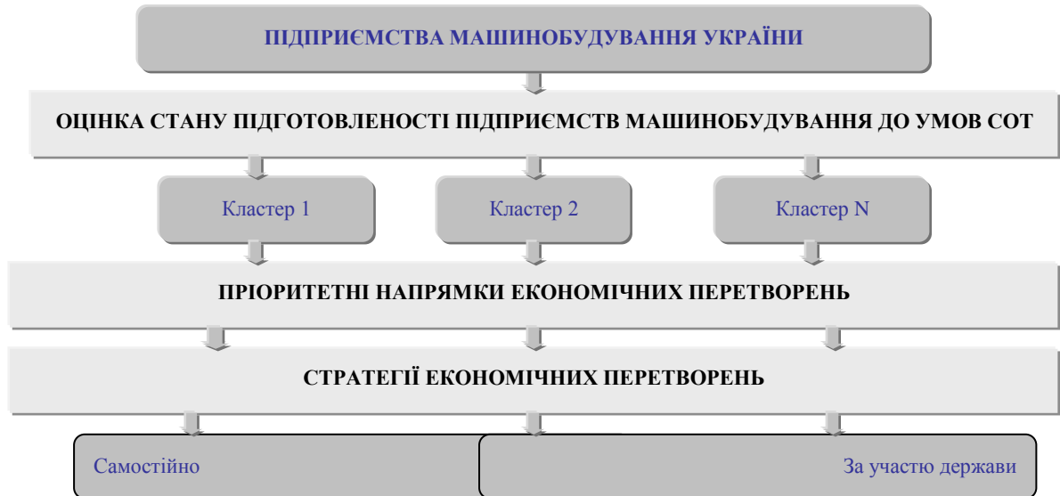
Рис. 1.2. Формування економічної стратегії адаптації машинобудівних підприємств до умов СОТ.

Приклад оформлення рисунку у вигляді схеми: