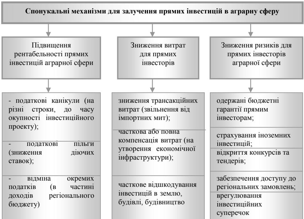
Рис. 2. Спонукальні механізми для залучення прямих інвестицій в економіку регіону для забезпечення конкурентоспроможності аграрної сфери (розроблено автором)

Структура механізмів, що "спонукають" залучення прямих інвестицій для розвитку аграрної сфери, підвищенні рівня її конкурентоспроможності, наведена на рис. 2.