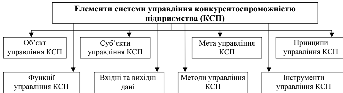
Рисунок 2 – Основні елементи системи управління конкурентоспроможністю підприємства

Структурні складові системи управління конкурентоспроможністю підприємства наведено на рис 2.