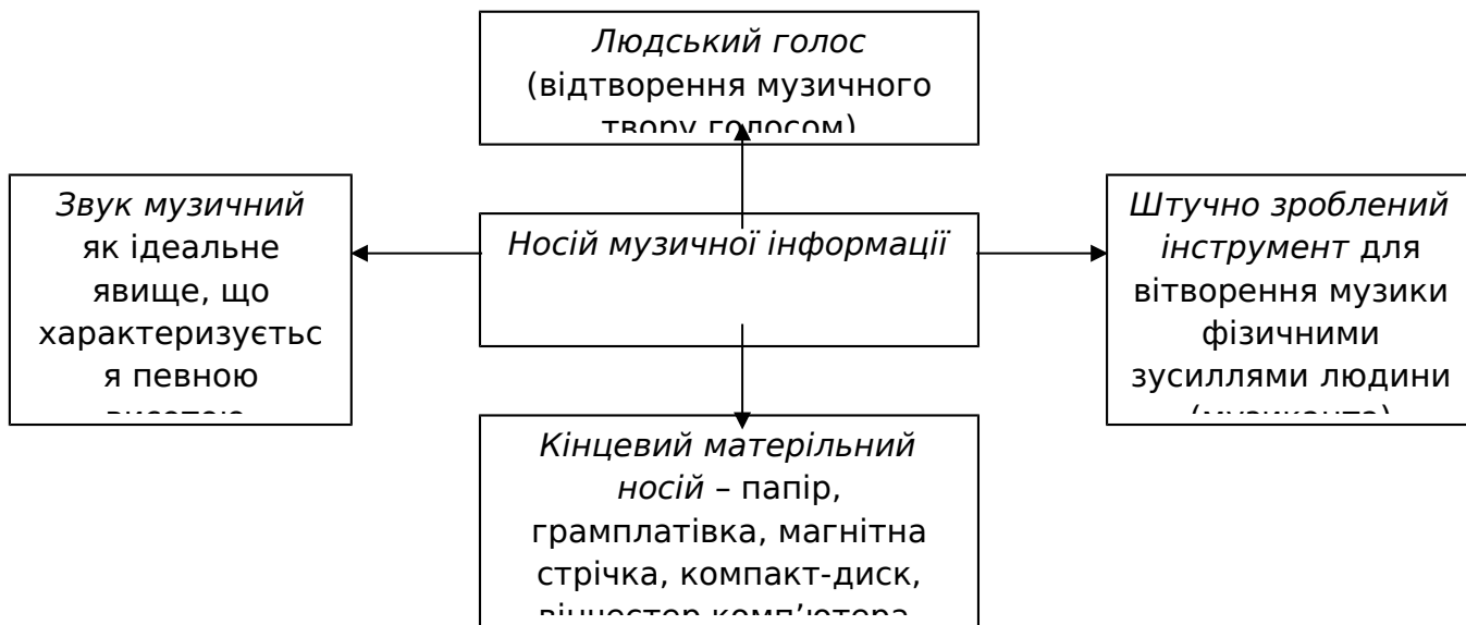
Рис. 2.1. Носії музичної інформації

Людський голос, як це показано на рис. 2.1, можна вважати специфічним носієм музичної інформації.