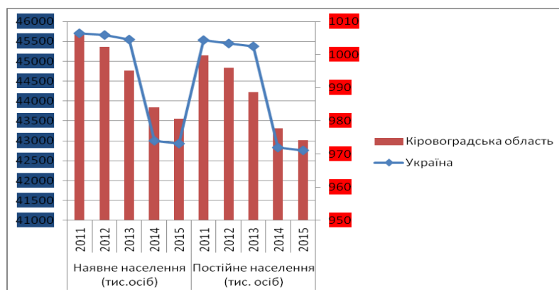
Рис. 2 Зміна кількості постійного та наявного населення в Кіровоградській області (2011-2015 р.р.)

Негативна тенденція до зменшення населення спостерігається й в Кіровоградській області. Дану динаміку ілюструє рис. 2. Як бачимо, значний стрибок в зменшенні населення в нашому регіоні відбувся на порозі 2013-2014 років, разом з цим загалом за останні 5 років кількість наявного та постійного населення в Кіровоградській області зменшилося на 25,6 тисяч осіб. Загалом, динаміка, зниження населення, яка прослідковується в змінах населення в Кіровоградській області є майже ідентичною і для всієї країни [1].