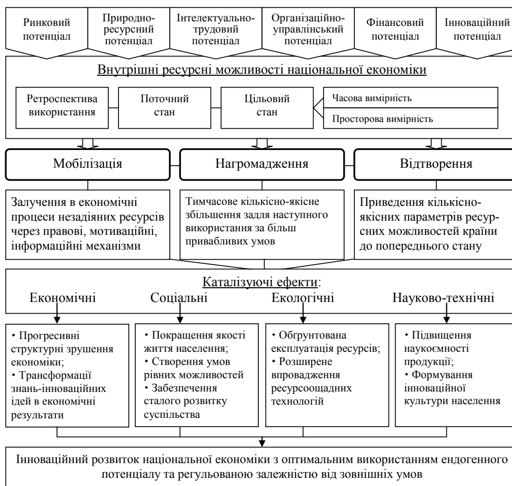
Рисунок 1 – Сміслове наповнення та логічність здійснення мобілізації, нагромадження та відтворення внутрішніх ресурсних можливостей економіки країни задля її інноваційного розвитку*

Оскільки в основі ендогенного потенціалу економіки країни лежать її внутрішні можливості та ресурси, то процес їхньої спрямованості на інноваційні цілі повинен передбачати їх мобілізацію з наступним нагромадженням і відтворенням (при потребі). Кожне з даних понять носить своє специфічне смислове навантаження, що має подальший відголосок у можливостях забезпечення інноваційного розвитку національної економіки через підтримку високопродуктивного наукомісткого виробництва (рис. 1). Мобілізація ж носить первинний характер відносно нагромадження й відтворення. Вона може здійснюватись на основі сформованих ресурсних можливостей і забезпечувати їх зростання через ефекти кумулятивної причинності позитивного досвіду продуктивної спрямованості їх використання. По суті мобілізація внутрішніх ресурсних можливостей держави задля забезпечення інноваційного розвитку повинна стати своєрідним макроекономічним прототипом фандрейзингу, коли через усвідомленість громадян у вигідності спрямування своїх активів (фінансових, інтелектуально-трудова, часових та ін.) в акумулятивній площині можна отримати помітний ефект (фандрейзинг як пошук ресурсів – людей, устаткування, інформації, часу, грошей та ін., для реалізації проектів та/або підтримки існування організації [14]).