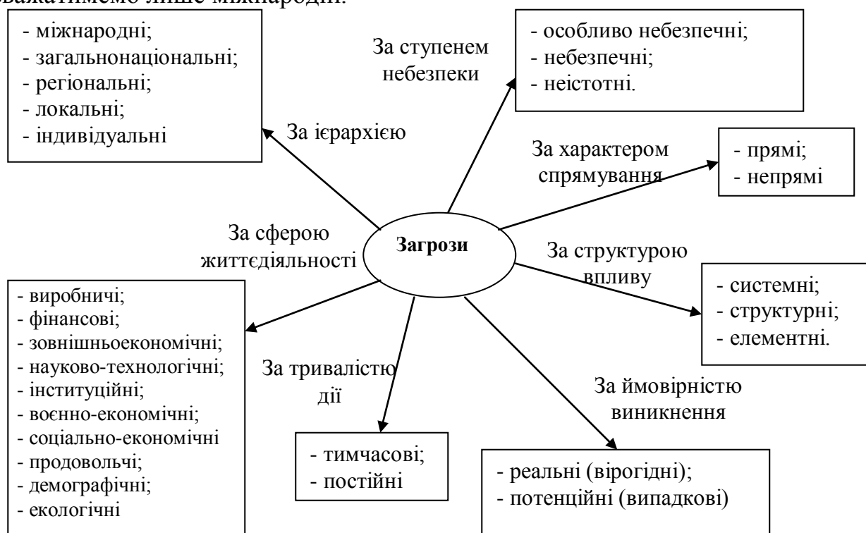
Рис. 8.1. Класифікація загроз економічній безпеці держави та регіону

Загалом, загрози економічній безпеці регіону можна класифікувати за такими є ознаками, як і для державного рівня (рис. 1.9), за винятком класифікаційного параметру «ієрархія управління». При цьому, відмінність полягатиме у тому, що для регіону регіональні, локальні та індивідуальні (особистісні) загрози будемо розглядати як внутрішні, а загальнонаціональні та міжнародні – як зовнішні. Тоді як для держави зовнішніми загрозами вважатимемо лише міжнародні.