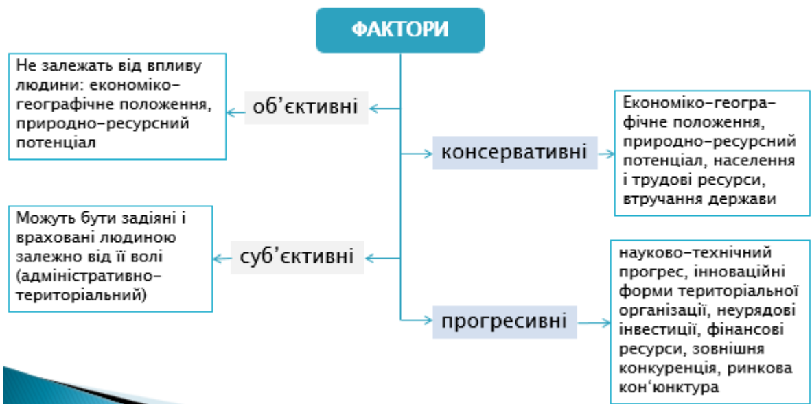
Рис. 3.1. Класифікація факторів регіонального розвитку