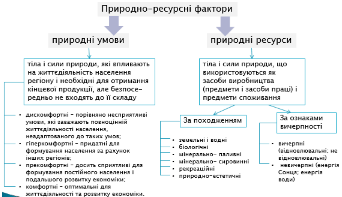
Рис. 3.2. Природно-ресурсні фактори регіонального розвитку

Природно-ресурсні фактори - це природні умови та природні ресурси регіону.