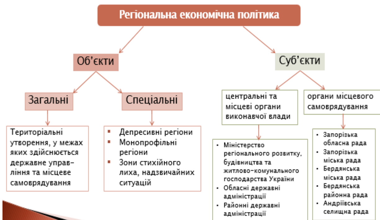
Рис. 6.1. Об'єкти і суб'єкти регіональної економічної політики

Об'єктами регіональної економічної політики можуть бути різні адміністративно-територіальні утворення або їх сукупність, суб'єктами — органи виконавчої влади та місцевого самоврядування, які безпосередньо виконують функції щодо забезпечення соціально-економічного розвитку регіонів (рис. 6.1). Державна регіональна економічна політика ґрунтується на положеннях Конституції України, Закону України «Про місцеве самоврядування в Україні», інших нормативно-правових актів.