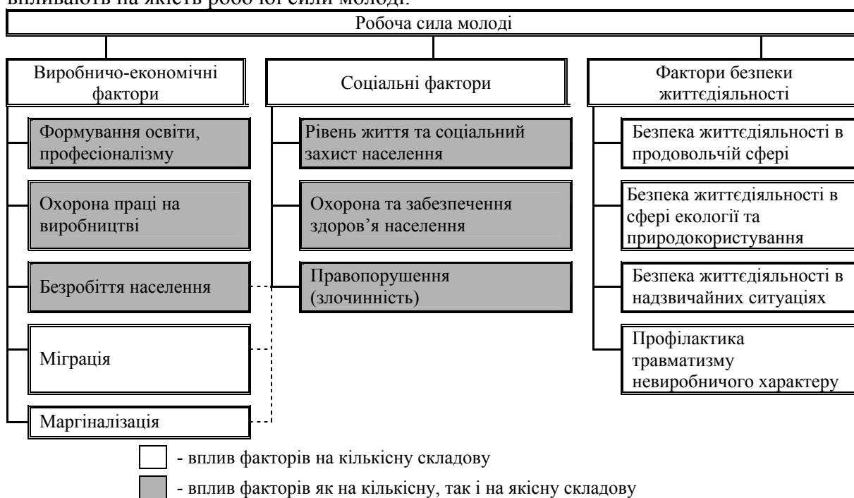
Рисунок 1 – Структура основних факторів впливу на формування робочої сили молоді

Чисельність робочої сили молоді знаходиться під впливом перерахованих факторів. Безробіття і занадто низький рівень життя буде підривати її здоров'я, змушувати багато працювати на різних ризикових, небезпечних та шкідливих роботах, що може призвести до смерті, каліцтва з майбутнім вибуттям в розряд економічно неактивного населення або того ж самого в наслідок втрати працездатності. Система охорони здоров'я буде впливати аналогічно. Крім того, можуть бути при низькому її рівні смертельні наслідки як результат оперативного втручання або невірного лікування. Система безпеки життєдіяльності повинна гарантувати життя молодим людям та збереження їх здоров'я в інших передбачених нею ситуаціях. Чітко відлагоджена система охорони праці не повинна допускати смертельних випадків, каліцтва, втрати здоров'я на виробництві. При високому рівні злочинності відбувається загибель людей, каліцтво, втрата здоров'я в наслідок хуліганських дій, гальмування підвищення людського капіталу. Крім того, втрачається частка працездатного населення при відбуванні встановлених термінів покарання та в наслідок підриву здоров'я в місцях покарання. Значну частку робочої сили молоді можна втратити і за рахунок міграційних процесів та маргіналізації її в ринкових відносинах. Певні втрати можливо нести і в системі освіти. Це ж саме можливо відмітити і стосовно факторів, які впливають на якість робочої сили молоді.