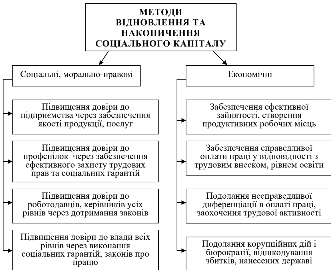
Рис. 2. Методи відновлення та накопичення соціального капіталу.

На наш погляд, відновлення соціального капіталу потребує тривалого часу для трансформацій масової свідомості і послідовних рішучих дій соціального, морально-правового та економічного змісту, що виходять, як правило, за межі організації (підприємства), зачіпаючи соціальне середовище, культуру, правовий простір. Бачення окремих методів відновлення та накопичення соціального капіталу у соціально-трудовій сфері ілюструє рис.2.