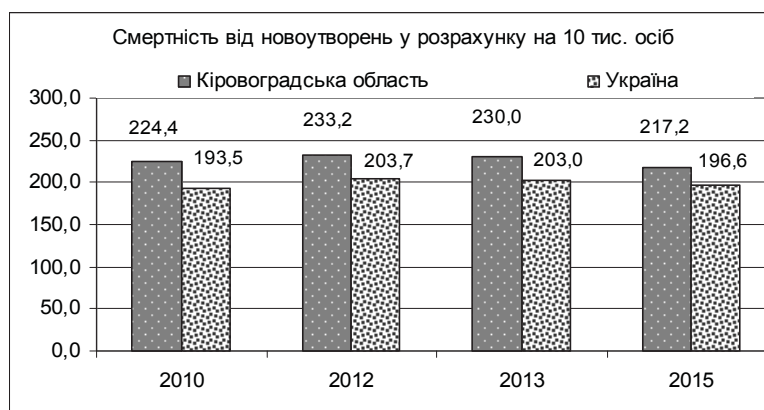
Рис. 1.2.2. Показники смертності від новоутворень в Кіровоградській області і в Україні (на 10 тис. населення)*

компенсацій населенню справа не зрушилася. Аналіз медико-демографічної статистики дозволяє зосередити особливу увагу на показниках надмірної смертності населення Кіровоградської області, що перевищують середньо-українські показники. Лише у 2015 р. смертність з причин новоутворень в Кіровоградській області була на 10,5% вище, ніж в середньому по Україні (рис. 1.2.2).