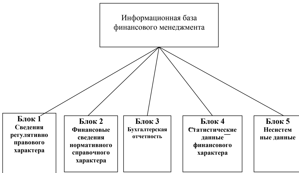
Рисунок 3 – Информационная база финансового менеджмента

В настоящее время наиболее известными и распространенными методами прогнозирования являются: экспертные оценки, экстраполяция, статистические методы, моделирования. Как упоминалось ранее, надежность прогнозирования зависит от полноты и достоверности используемой информации, которую необходимо накапливать и систематизировать в банке данных. На рис. 3 представлена схема формирования информационной базы принятия финансовых решений.