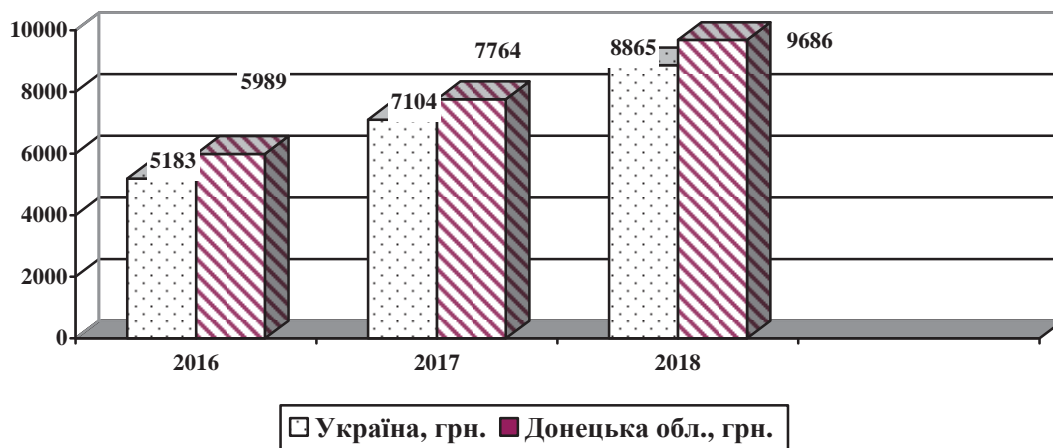
Рисунок 4 – Середньомісячна заробітна плата працевлаштованих осіб в цілому в Україні та Донецькій області, грн.

Успішне функціонування підприємців малого та середнього бізнесу дає змогу розширювати свою діяльність, підвищувати своїм робітникам заробітну плату. Безумовно розмір заробітної плати впливає на вибір підприємства робітником. Дослідження динаміки середньомісячної заробітної плати працевлаштованих осіб в цілому в Україні та Донецькій області виявив позитивний наступний факт (рис.4): заробітна плата в Донецькій області вища за заробітну плату в цілому по Україні за період з 2016 року з 15,5% до 9,3% у 2018 році.