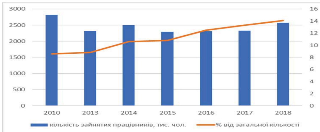
Рисунок 1 – Показники діяльності суб'єктів господарювання за кількістю зайнятих працівників (ФОП-фізичних осіб, підприємців)

Аналіз основних показників діяльності суб'єктів господарювання дає змогу стверджувати, що поступовими темпами спостерігається зростання кількості фізичних осіб - підприємців (рис. 1).