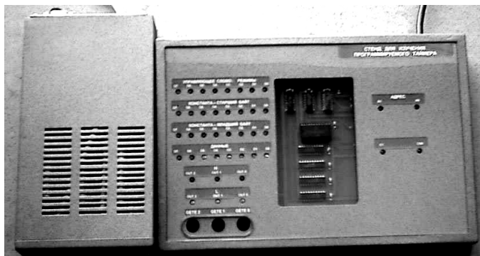
Рисунок 2 – Апаратний емулятор (стенд) мікросхеми i8253

мікросхеми. Крім того, НМК візуалізує внутрішню роботу мікросхеми після її програмування, а також процеси, які в ній протікають.